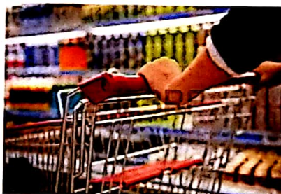
je fais toujours les courses