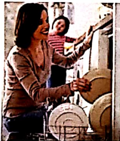
je parfois vide parfois le lave-vaisselle