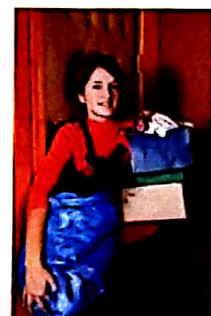
je sors parfois toujours les poubelles