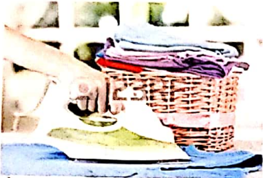
je ne repasse pas jamais