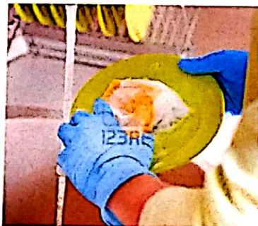
je fais toujours la vaisselle