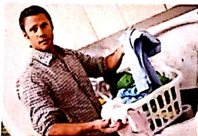
je fais toujours une lessive