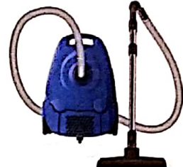
je parfois passe l'aspirateur parfois