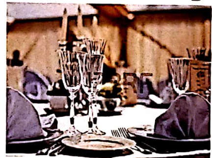
je mets souvent la table