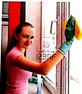
je ne parfois nettoye parfois jamais les vitres