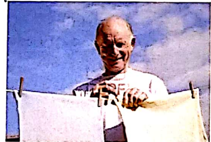
je toujours étends le linge parfois